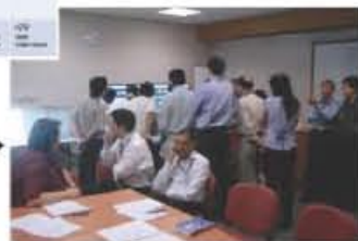
Breast tumor boardの風景。病理医、外科医、放射線科医、Oncologist、Research nurseが参加。

officer 6人からなっていた。このうちconsultantはUSAかUKでcertificateされたoncologistであり、誰かが辞めれば本国から補充がある。medical officerはシンガポール雇いで、地元出身者2人、フィリピン人3人、ポルティモア本校1人 (短期滞在) であった。medical officerは自分で化学療法の決定をすることはできず、必ずconsultantのサインが必要。consultant 5人は化学療法に関して (白血病は扱っていない)、それぞれ専門はあるものの総じて様々な癌腫に関してASCOやASCO GIの最新データをもとに、最新の治療を行うエビデンスに基づいた非常に豊富な知識を持っていた。また各診療科とtumor boardを行い、治療方針を決定していた。各癌腫に対するレジメンがきちんと整理されていた。