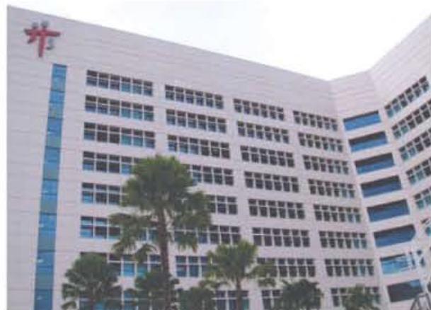
Johns Hopkins Singapore (JHS) は、Tan Tock Seng Hospitalの一角に存在している。JHSの外来は1階に、病棟は13階にある。

Breast Tumor Board Meetingに参加。病理医が2人、外科医、放射線科医、oncologistそれぞれ3~4人出席していた。計11人の患者について治療方針を決定し、その方針に従って直ちに治療を開始していた。