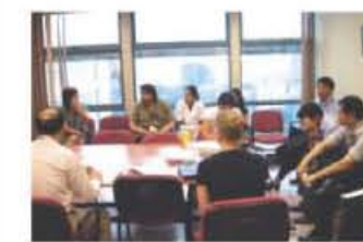
◀ JHSのスタッフによるカンファレンス。

その後、Dr.Bharwaniの外來見学。外來終了後、約1時間を割いてbreast ca. updateをlectureしてくれた。午後、Radio-Oncologist tumor boardに参加。