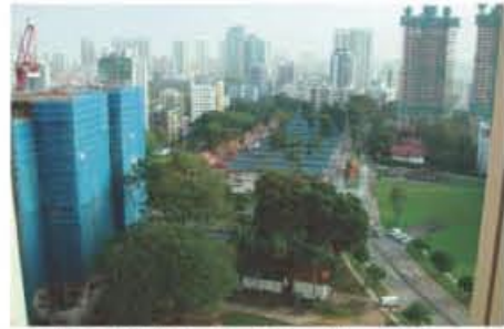
JHSの病棟はTan Tock Seng Hospitalの13階にあり、非常に眺めが良い。

話せない患者もいたが、周囲のスタッフに必ずだれか中国語から英語に通訳できる人がいるため意思疎通の問題はなかった。また、地理的に中東からも比較的近く、最先端の抗がん剤治療を受けるため、JHS患者の実に7割がUAEなど中東から来ていた。そもそも2001年の9.11アメリカ同時多発テロ以降はアメリカへの入国が難しくなったこともあり、中東からの患者を受け入れるためにシンガポールにJHSを設立したようである。彼らに対するアラビア語の通訳は入院・外来で計7人が診療の補助をしていた。