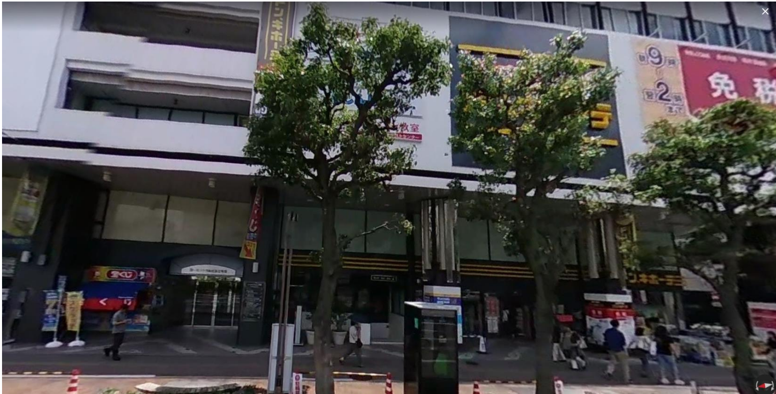
岡山駅前・第一セントラルビル2号館 正面玄関(ドン・キホーテ横)

岡山空港ターミナルビル1F正面玄関を出まして『岡山駅方面』バスのりば(2)番で有料バスをご利用下さい。