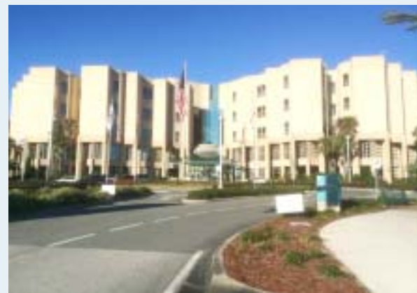
Moffitt Clinic Surgery Reception center. 2階が手術部