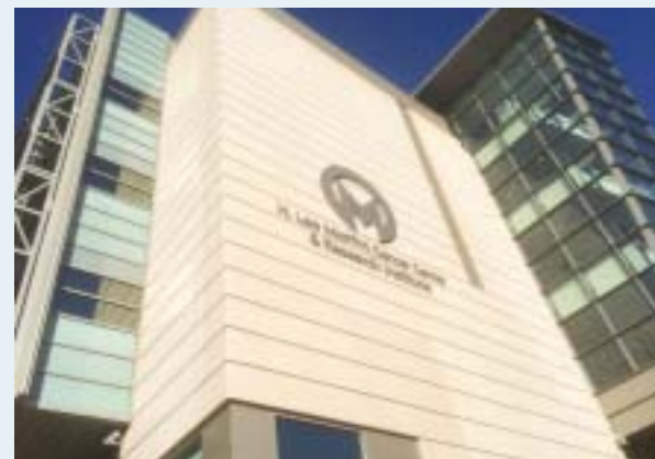
隣接する研究施設 Vincent A. Stabile research Building. 研究費の獲得状況について3年毎の見直しがあり、応分の研究スペースが与えられるなど、競争が激しいとのこと