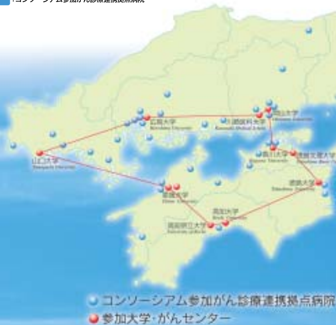
●:コンソーシアム参加がん診療連携拠点病院 ●:参加大学・がんセンター