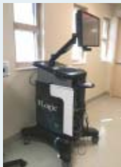
手術において併用したナビゲーション気管支鏡システム

食道がんに対するロボット支援胸部食道全摘・胃管再建術(Dr.Fontaine)を見学した後、肺・食道手術に於けるアプローチ方法(ポート位置、患者体位の取り方等)について詳細な解説を受けた。