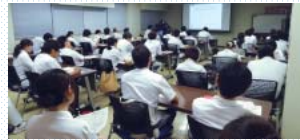
オンコロジーミーティング

キャンサーボードとしての個別症例検討カンファレンスは、各臓器がん単位で複数の診療科間で定期的に多数開催されている。他方で、広島大学病院内で毎週1回定期的に開催される多職種参加型がんカンファレンスの意義は、各種がんに関連した共通の最新情報共有とともに、とすれば希薄になりがちな院内交流や、県内がん拠点病院とのネットワーク形成、専門医・大学院・学部教育にも重要な役割を果たしている。