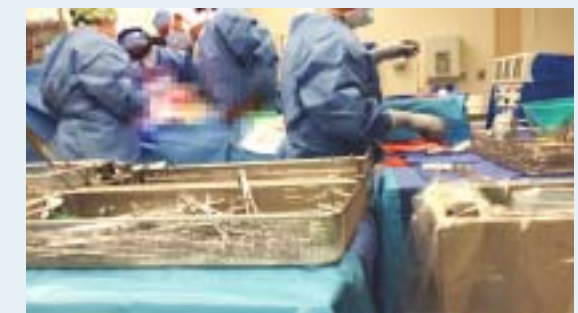
他の北米のORと同様、Moffitt cancer centerのORも十分に広くback tableに広げる手術器具の数量は日本のそれよりも多い

筆者の勤務する高知大学医学部附属病院におけるがんボードは、治療終了後の症例について内科・外科・放射線科・病理が発表しあうReviewの形式で開催されるに留まるが、本施設では、毎週、各科の新患者全員について、診断と治療方針を検討していた。胸部外科医もボード終了後にがんボードでの決定事項を患者に電話し治療方針を伝えるなど、がんボードが診療科の枠を超えて治療方針最終決定の場として機能しており、医局講座に縛られない合理的なシステムとして見習う面が大きいと感じた。